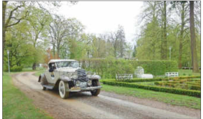
Preußen-Klassik-Rallye zu Gast im Wehrinselpark