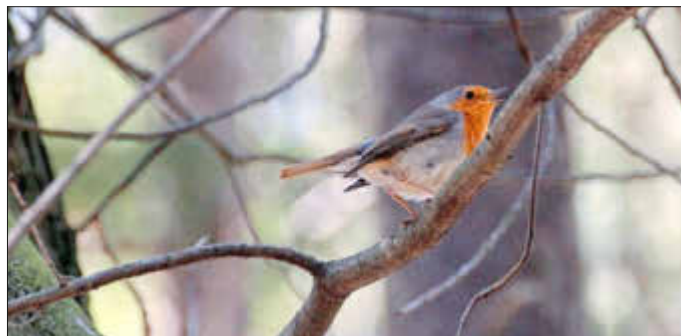
Rotkehlchen in Reuthen