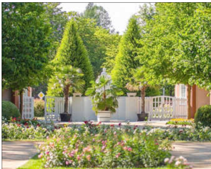
Start in die Rosengartensaison

Am Sonntag, den 5. Mai ab 10 Uhr laden die Stadt Forst (Lausitz) und der Förderverein Ostdeutscher Rosengarten 1913 e.V. zum offiziellen Start in die Parksaison ein.