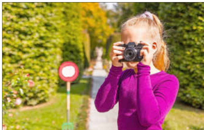
Im Reich der Sinne beim Rosengartensonntag