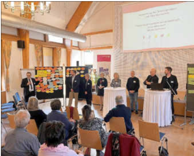
Großes Interesse beim Museums-Workshop

Ein aufregender Museums-Workshop fand am 12. März 2024 im Hornoer Krug im Forster Ortsteil Horno unter sehr großer Publikumsbeteiligung statt. Das Museumsteam gab einen Überblick über die Inhalte und das Gestaltungsbüro Duncan McCauley präsentierte den insgesamt 90 anwesenden Gästen erste Einblicke in die neue Gestaltung.