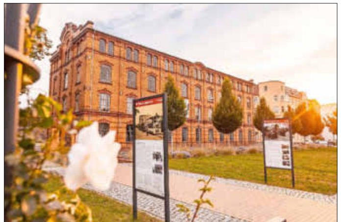
Stadtführung „Tour de Forst (Lausitz)“