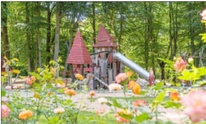
Kindertag auf dem Wehrinselpark

Der Internationale Kindertag ist ein ganz besonderer Tag für die Kleinsten unter uns und den feiern wir im Ostdeutschen Rosengarten mit der freundlichen Unterstützung der Sparkasse Spree-Neiße. Forster Sportvereine und der Karnevalsverein Forst-Sacro 1979 e.V. stellen sich vor und halten tolle Mitmachangebote an dem Tag bereit. Für die Kreativlinge unter Euch wird es eine Bastelecke und verschiedene Ausmalbilder geben. Die Sportskanonen unter Euch können sich auf der Hüpfburg oder beim Torwand schießen auspowern.