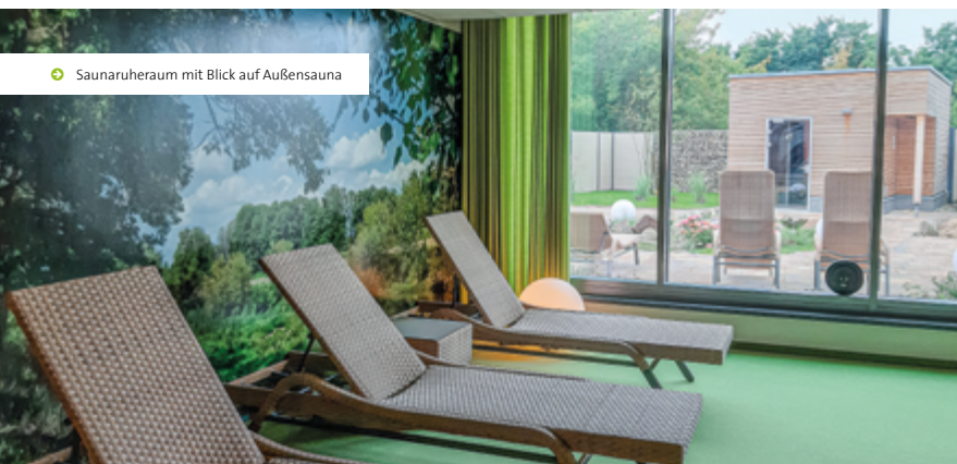
◦ Saunaruheraum mit Blick auf Außensauna