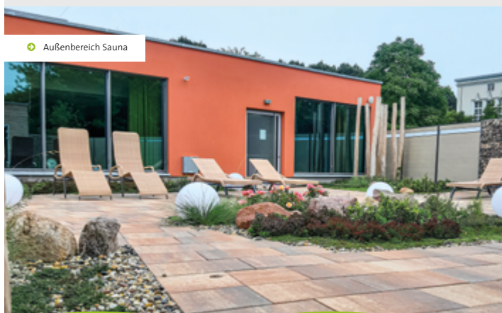
◦ Außenbereich Sauna