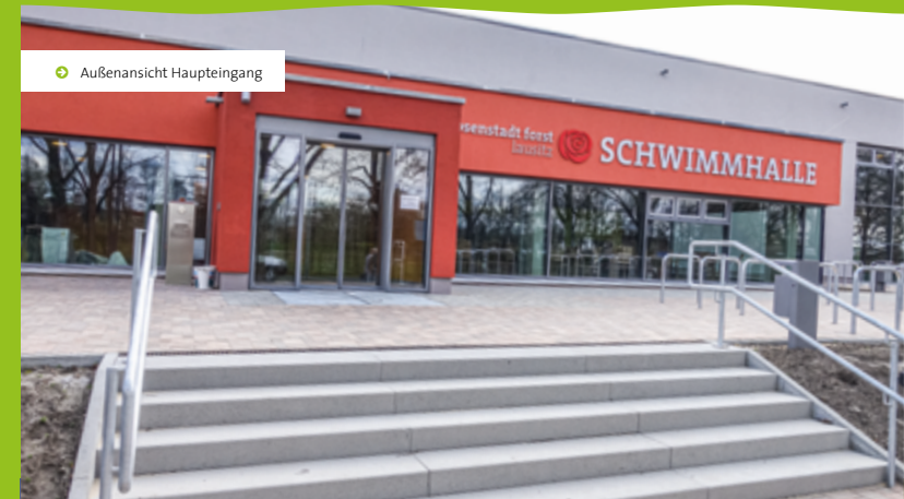
➤ Außenansicht Haupteingang